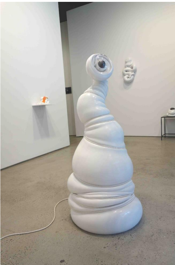
L'Osservatore (Beobachter) , 2016, Laaser Marmor, poliert, Plastikkugel, Überwachungskamera, Kabel 59 x 160 x 138 cm