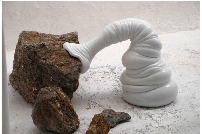
Myzot Steinbeißer , 2011, Laaser Marmor, poliert, 104 x 64 x 54 cm