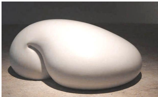
Smörf 28 , 2003, Laaser Marmor, poliert, 42 x 32 x 17 cm