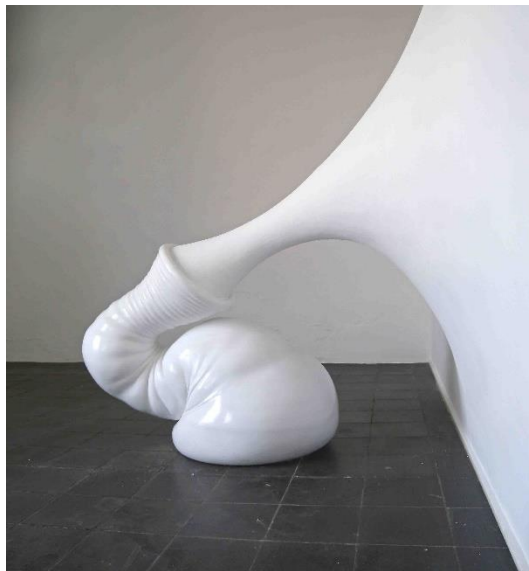
Walli , 2014, Laaser Marmor, poliert, Styropor, 88 x 55 x 60 cm / 200 x 180 x 200 cm